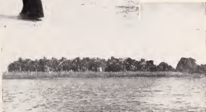
Cocal de la Misión de Guayo en la hermosa playa de Burojoida.

Uno de los más experimentados misioneros en carta particular reciente ha emitido su opinión sobre la Misión de Guayo con estas palabras: